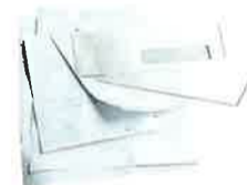
Feuilles de papier, enveloppes