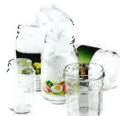
Pots et bocaux

Les emballages en verre se recyclent à l'infini