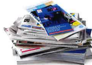
Journaux, revues, magazines, prospectus, publicités

mais je ne mets pas : essuie-tout, mouchoirs, papier en aluminium, papier plastifié indéchirable