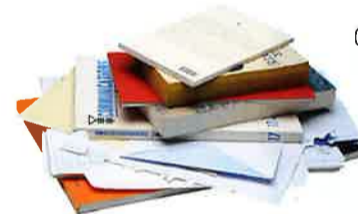
Courriers, lettres, impressions, livres, cahiers, annuaires, dictionnaires